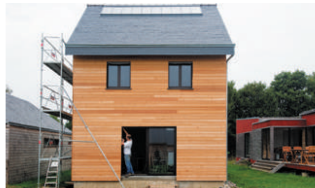
Le CCMI sans fourniture de plan peut comporter des « lots réservés » que vous vous chargez de réaliser.

Dans le CCMI sans fourniture de plan , vous fournissez le plan (élaboré par vous, un architecte ou un autre professionnel, mais sans aucun lien avec le constructeur), les travaux sont assurés par une seule entreprise, avec qui vous passez ce CCMI, ou par plusieurs. Dans ce cas, le constructeur se charge au minimum des travaux de gros oeuvre, de mise hors d'eau (charpente et couverture) et de mise hors d'air (menuiseries extérieures). Les travaux restants sont assurés par des entreprises avec lesquelles vous passez des contrats d'entreprise lot par lot (voir ci-après).